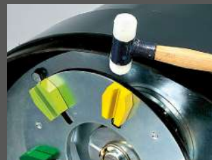
ETX-быстрая смена алмаза