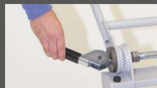
Направляющая скоба перемещается